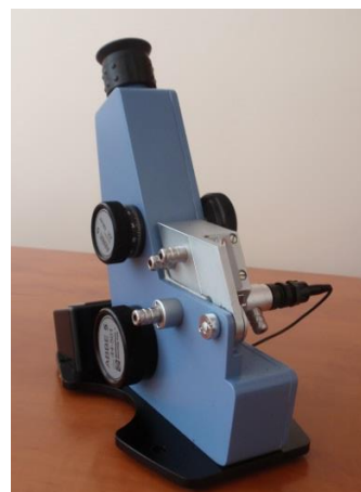
Rys. 2. Refraktometr Abbego (widok z dwóch stron)