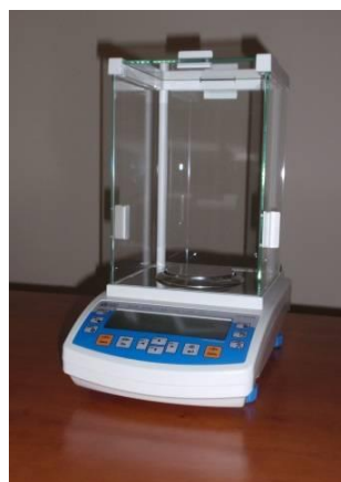
Rys. 3. Waga analityczna