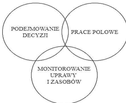
Rys. 1. Obszary wprowadzania narzędzi Rolnictwa 4.0 w zakresie uprawy roślin